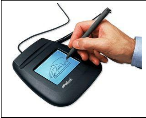
التوقيع باستخدام القلم الإلكتروني