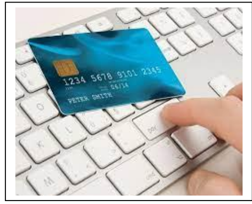
التوقيع بالرمز السري