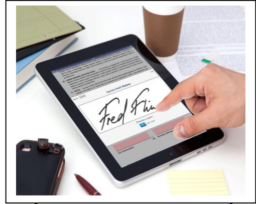
التوقيع اليدوي المرقم